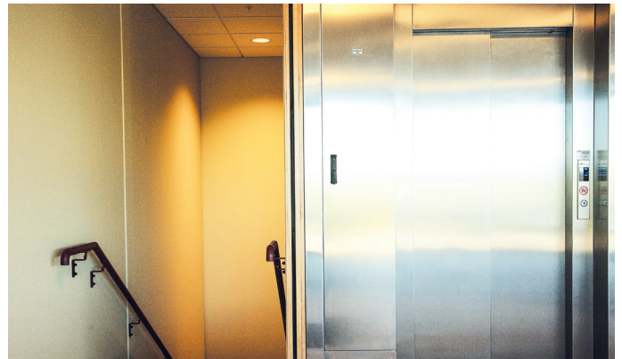
Lift Tech har levert heisen i bygget.

– Alt ser greit ut. Det er blitt et veldig bra prosjekt. Det er bygget på rekordtid. Vi fikk noen problemer med byråkratiet i juni i fjor, da det kom krav fra kommunen om et renseanlegg vi ikke hadde planlagt. Det gjorde prosessen mer komplisert.