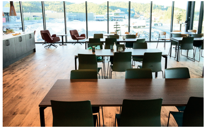
Kantinen i andre etasje i kontordelen.