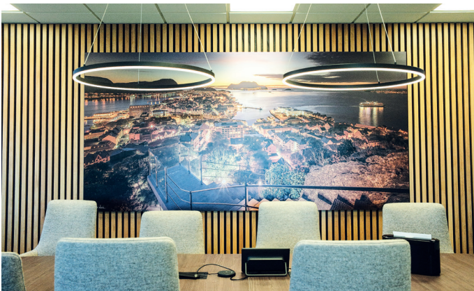
Et møterom i kontordelen med bilde fra Ålesund sentrum på veggen.