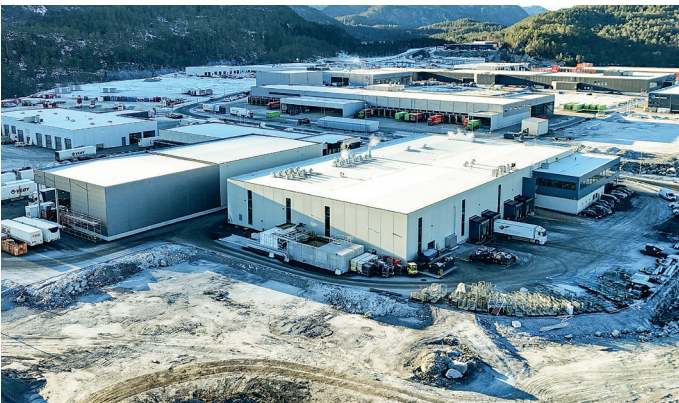
Oversiktsbilde over store deler av Digerneset Næringspark, med det nye Nor Tekstil-bygget på 6.350 kvadratmeter nærmest. Veøys terminalbygg er nabo til venstre.