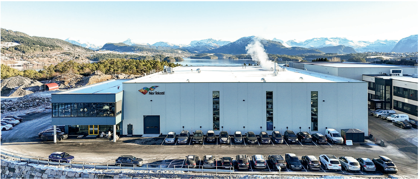
Det nye bygget til Nor Tekstil i Digernes Næringspark sett fra hovedinngangsområdet mot vest.