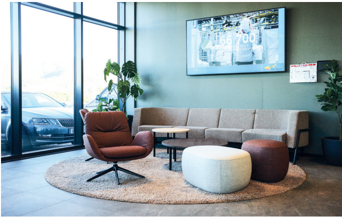
En sosial sone i inngangspartiet.