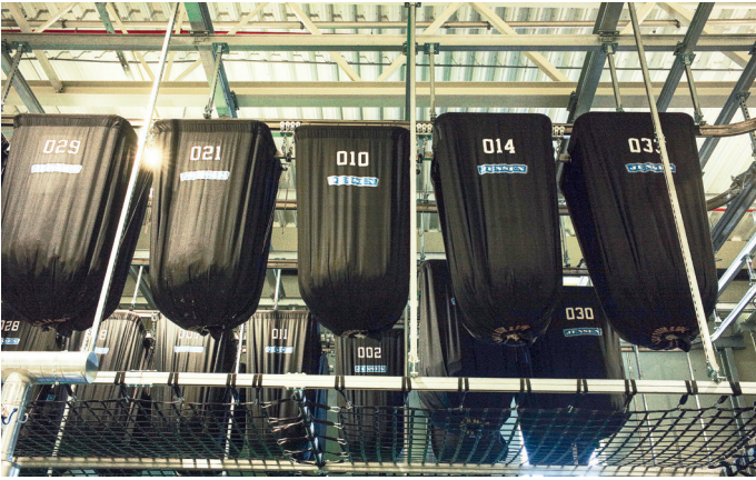
Sekker med skittentøy sendes på transportbånd inn i vaskeriet.