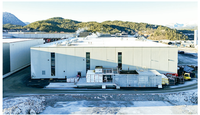
Nybygget sett fra baksiden mot øst. Betongkonstruksjonen med kumene er renseanlegg der slam blir utskilt og levert til Norsk Gjenvinning.

mens kontordelen har en miks av flis, teppeflis og laminat. En vegg bygget av sandwichelementer skiller skitten og ren sone i industridelen. Det er 14 kontorer der noen er bygget med systemglassvegger, mens andre er i åpent landskap. Kontordelen har systemhimling i tak.