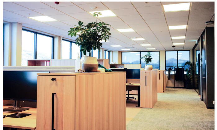
Åpent landskap i denne delen av kontorområdet.