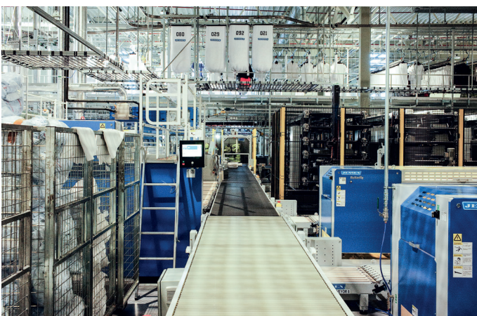
Rent tøy kommer til oppsamling på dette produksjonsbåndet.

Sted: Digerneset Næringspark i Ålesund Prosjekttype: Vaskeri med kontor Byggherre: Digerneset Næringspark AS Totalentreprenør: Peab K. Nordang Prosjektkostnad: Ca. 350 millioner kroner ekskl. mva. inkludert teknologi Areal: 6.350 kvadratmeter Prosjektledelse byggherre: Erland Reite (Wenaas Eftf.) og Jostein Løken (AFRY) Arkitekt, landskapsarkitekt og SØK: On Arkitekter Rådgivende ingeniører: RIB: Conplan | RIBr: Konseptia | RIAku: COWI | RIByfy: Riksheim Consulting Underentreprenører og leverandører: Tømrer- og betongarbeid, montering: Peab K. Nordang | Rør, elektro og ventilasjon: Bravida | Grunnarbeider: Busengdal | Betongelementer: Spenncon | Stålkonstruksjoner: IPOA | Stålsandwich, TRP: GH Prosjekter | Gulvstøp: Tiller Vimek | Porter: Assa Abloy | Lås og beslag: Låsservice | Taktekkning: Skårhaug Taktekk | Blikkenslager: Blikkenslagermester Even Helgesen | Metallarbeider: Midthaug | Vindu og glassfasader: H-fasader | Solskjerming: HD Sol | Malerarbeider: Martin Uggedal | Systeminnredning: Moelven Modus | Fast bygginnrøding: Designa | Heis: Lift Tech